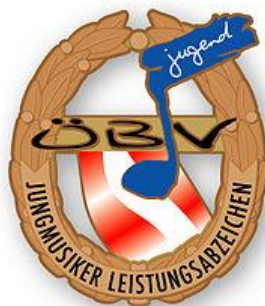
JMLA Abzeichen in Bronze